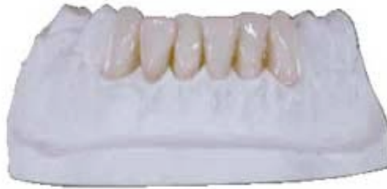
Bridge en The.r.mo Bridge , avec caractérisation superficielle