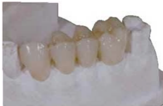
Prothèse en The.r.mo Bridge , avec caractérisation interne et addition d'un composite transparent